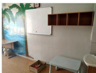
Так игровая комната выглядит сейчас