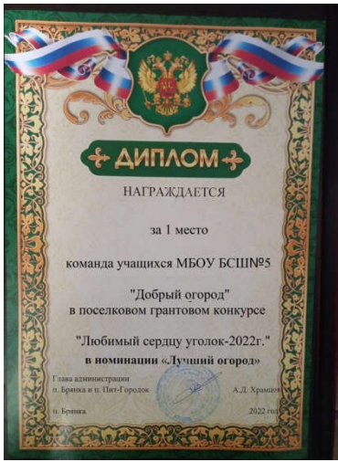
Снимок 20 «Грамота»