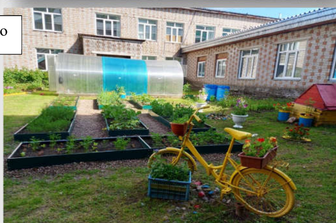
Снимок 2,3,4,5 «Участок №1 Овощных культур»