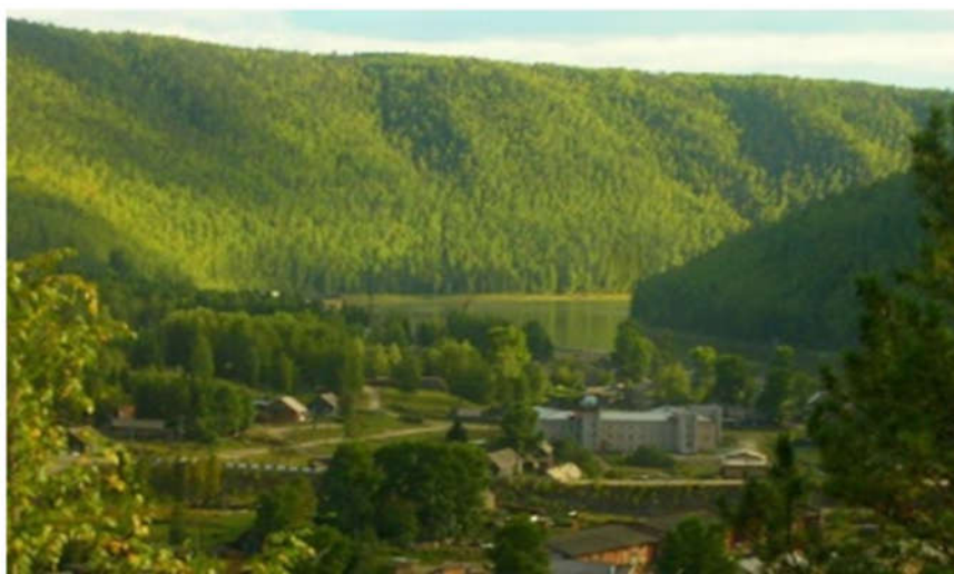
Снимок 1 «п.Брянка и административное здание в центре»