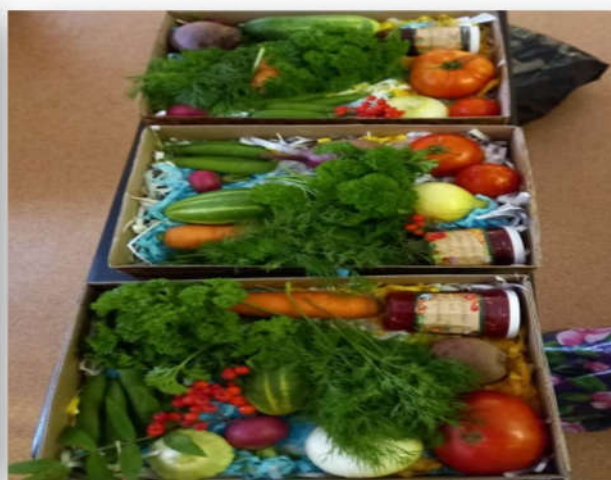
Снимок 16,17,18,19 «Поселковая осенняя ярмарка»