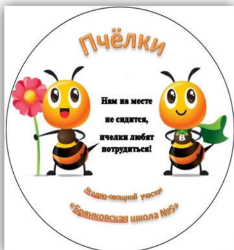
Эмблема «Добрый огород»