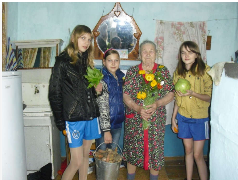
Снимок 14,15 «Социальная помощь овощами пенсионерам»