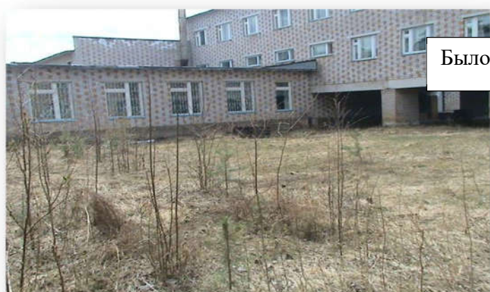
Было до 2015