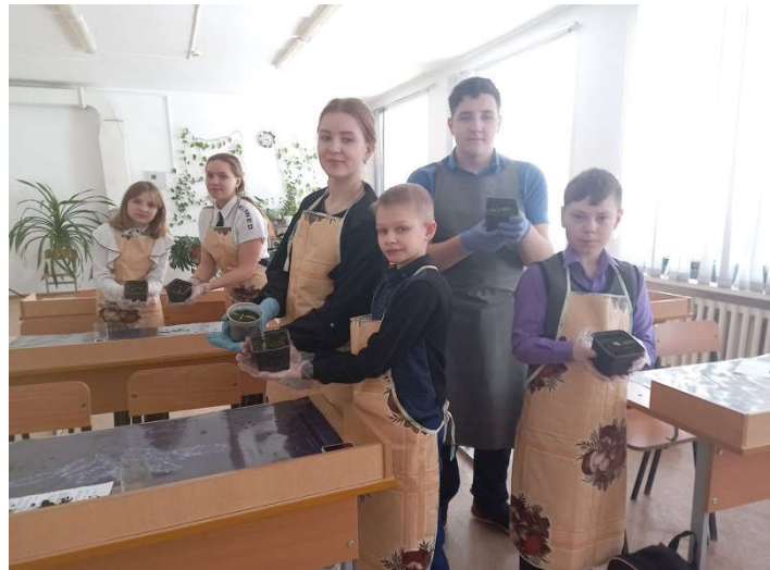
Снимок 21. «Мы наставники»