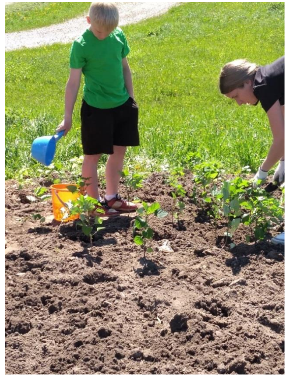
Фото 8. Посадка цветов на клумбу