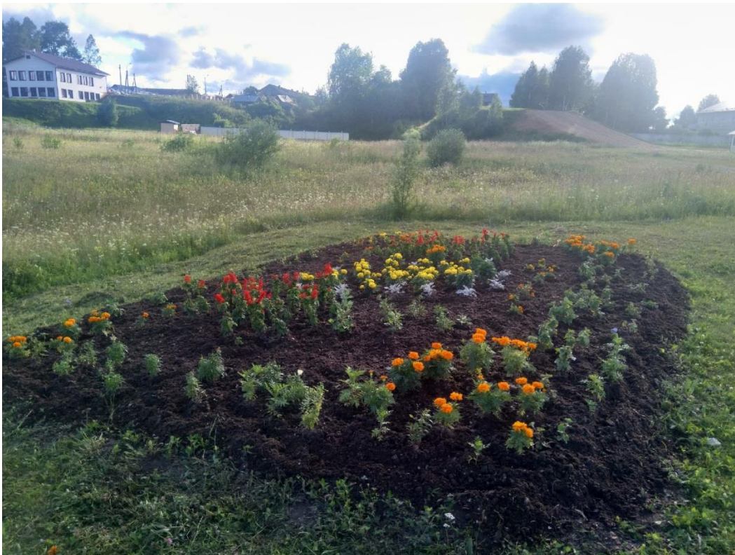
Фото 11. Клумба «Баской платок», середина июня 2022