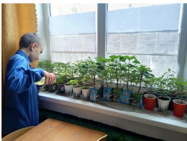
Фото 3. Полив рассады