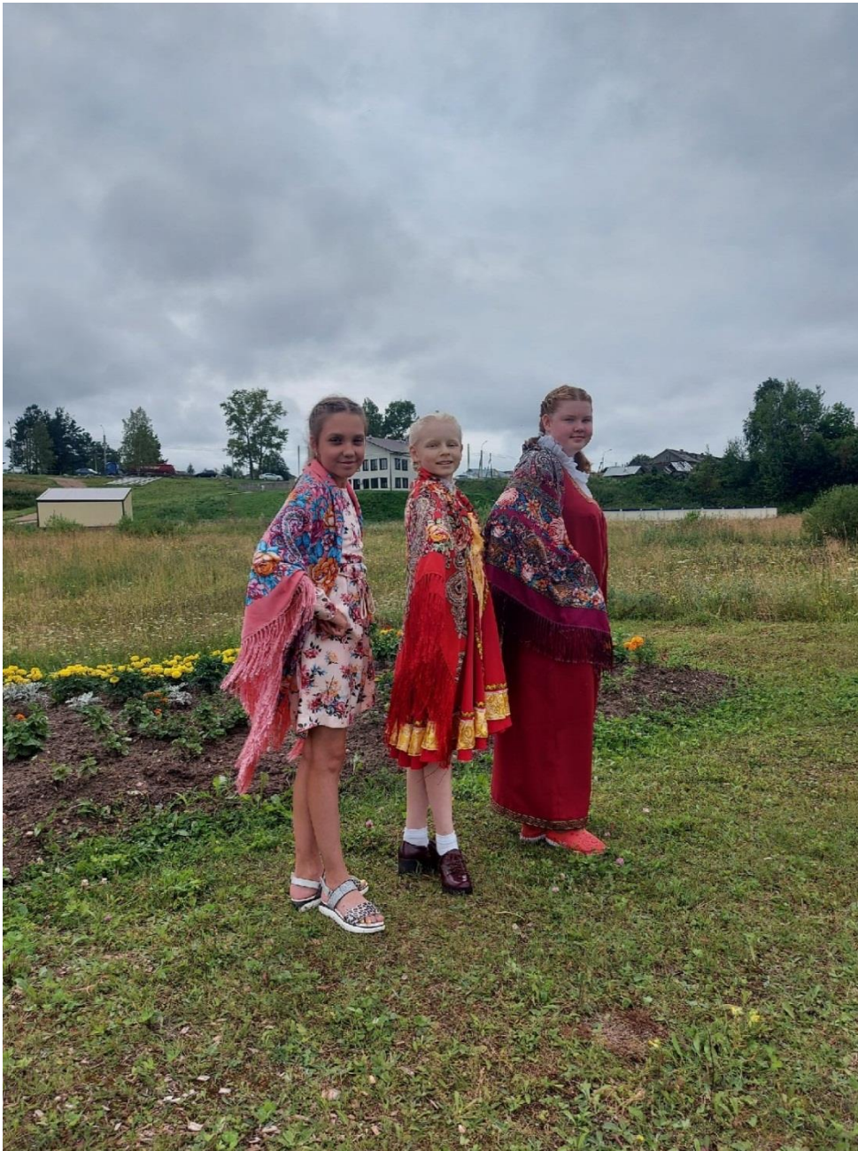
Фото 12. Презентация клумбы для конкурса «Год культурного наследия. Устьянские рукотворцы: от традиций к новому»