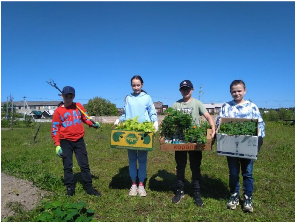
Фото 9. Посадка цветов на клумбу