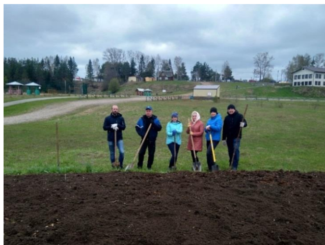
Фото 4. Вскопка клумбы