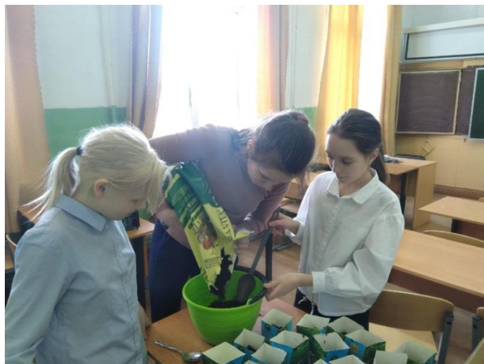
Фото 2. Посадка рассады