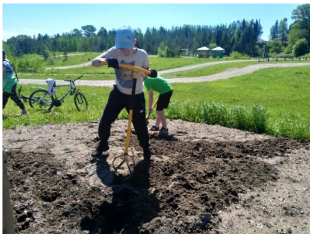
Фото 5. Повторное рыхление