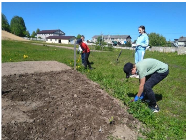
Фото 6. Подготовка клумбы к посадке