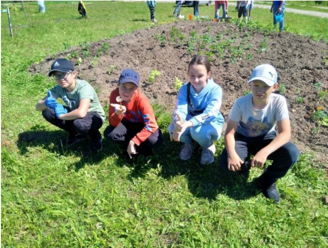
Фото 10. Клумба «Баской платок» начало июня 2022