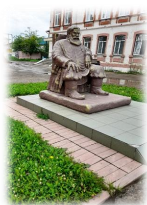
Территория возле памятника сибирским купцам