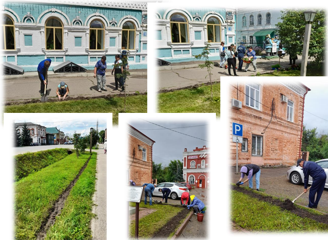
Подготовка молодого поколения к профессиональной деятельности.