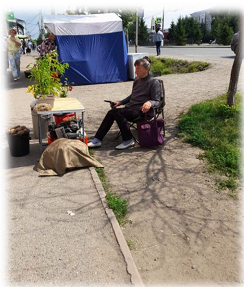
Центральная улица г. Мариинска