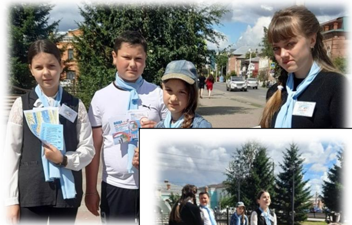
Акция: «Мы за красивый город»