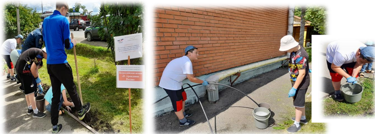
Муниципальные конкурсы: «Чудеса природы», «Я и природа»