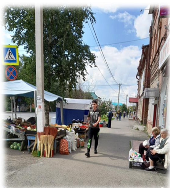
г. Мариинск, ул. Ленина