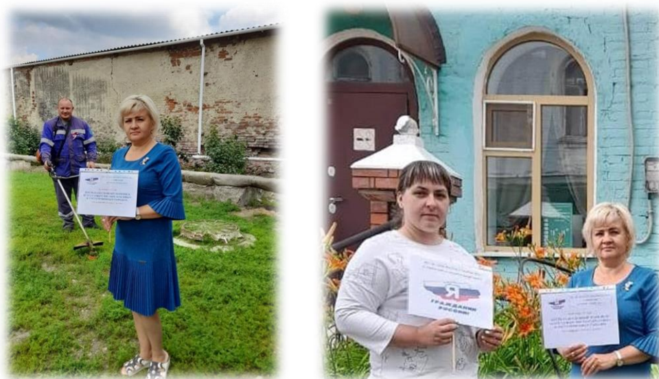
Сотрудники музея «Береста Сибири» г. Мариинск

Привлечение к реализации проекта неравнодушных граждан г. Мариинска;