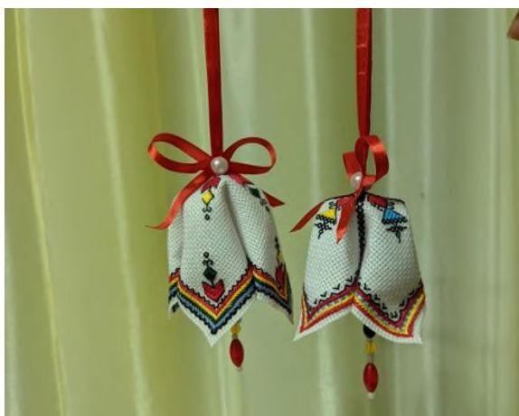
Новогодние сувениры - Елочные игрушки «Колокольчики»