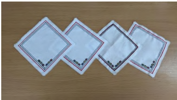
Платочки-обереги для бойцов СВО