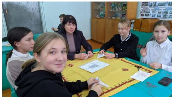
Обучающее занятие в школе