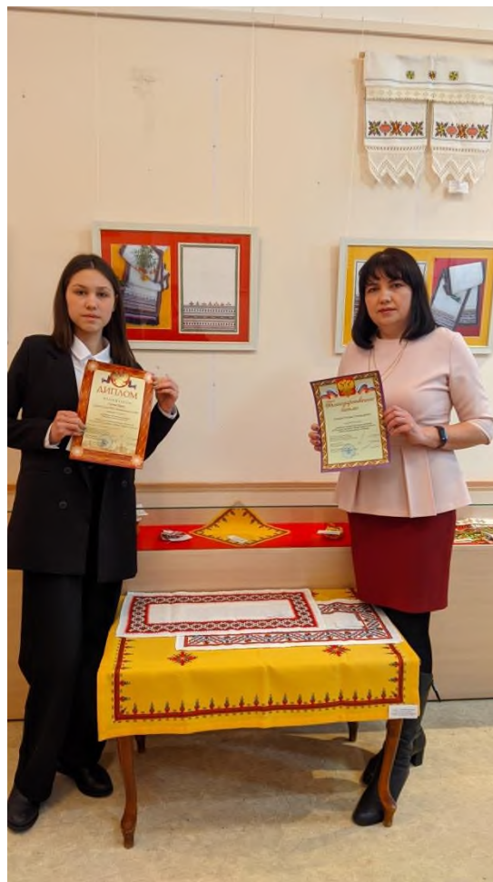
Районный конкурс-выставка чувашской национальной вышивки «Чăваш тĕррин ытамĕнче»