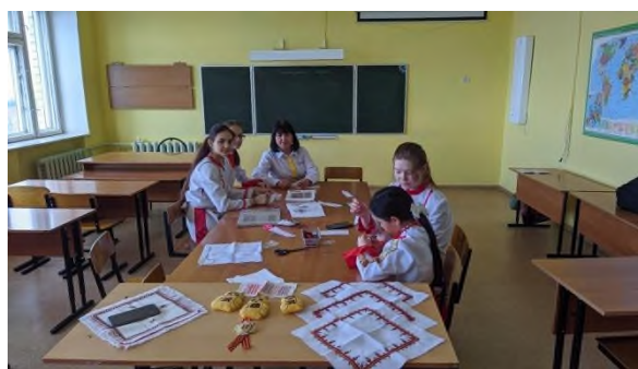
Мастер-класс «Чувашская вышивка» на зональном родительском форуме в МБОУ «Калайкасинская СОШ»