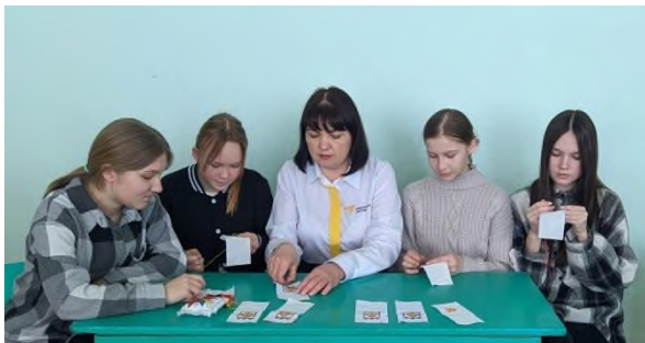
Обучающее занятие в школе