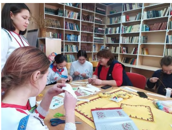
Мастер-класс «Чувашская вышивка» на региональном родительском форуме в МБОУ «Большесундырская СОШ»