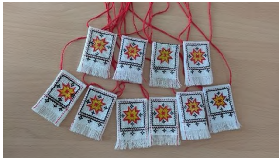
Сувениры-обереги для бойцов СВО